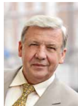
Président de la Région Primorje-Gorski kotar Vidoje Vujić

La mer unit les gens. Les ports invitent les marins, et de la même façon nos ports sur la côte et sur les îles du Kvarner invitent tous les marins amateurs de la mer, de l'héritage maritime, des bateaux et des barques, amateurs des rencontres entre hommes de la mer, à venir nous rendre visite. Venez ! Nous serons très heureux de vous accueillir en Croatie, le pays des mille îles, surtout dans le Kvarner où les bons vents gonflent les voiles de marins adroits !